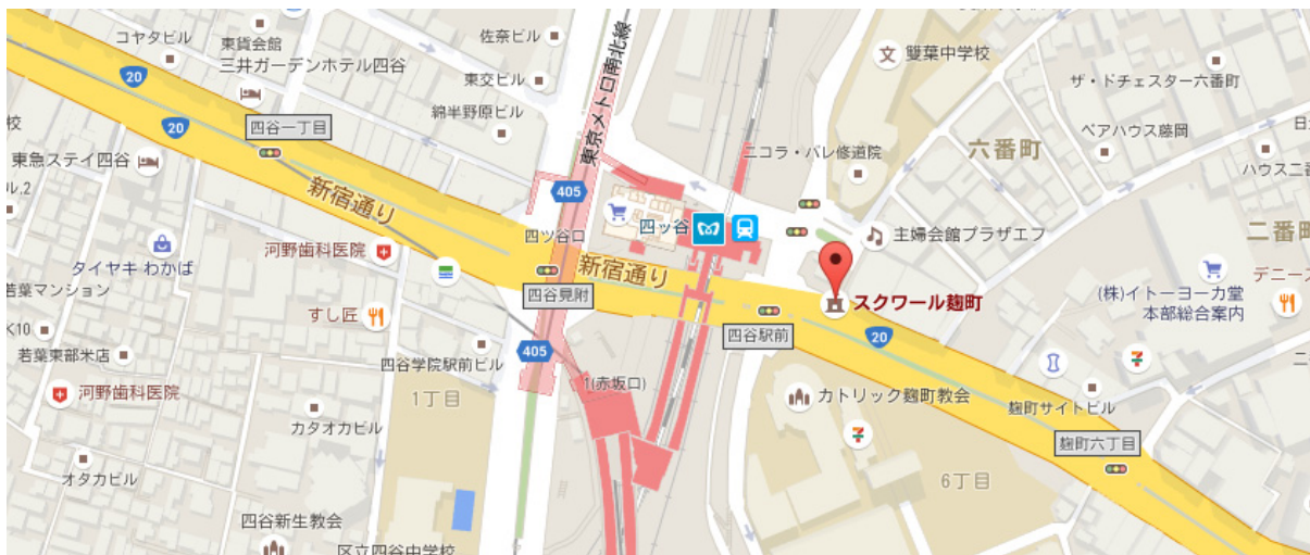
スクワール麹町は、JR 中央線・総武線 四谷駅 の麹町口を出た目の前にあります